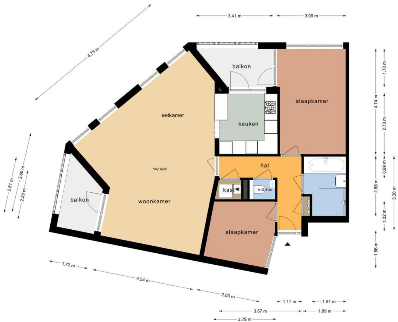
Poortershof 20 - Leiderdorp Derde Verdieping

De plattegronden zijn geproduceerd voor promotionele doeleinden en ter indicatie. Aan de plattegronden kunnen geen rechten worden ontleend.