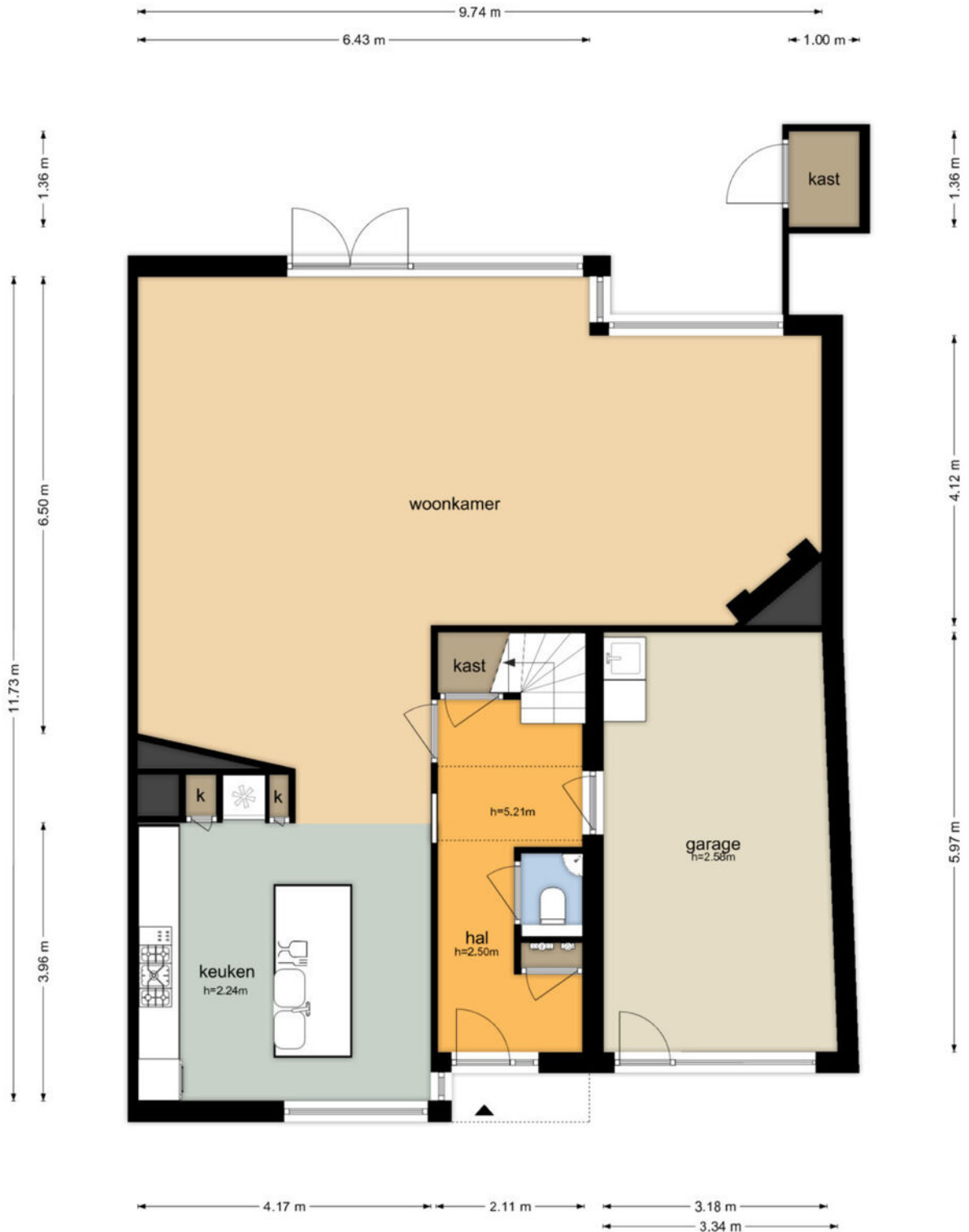
Brugwacht 140 - Leiderdorp Begane Grond

De plattegronden zijn geproduceerd voor promotionele doeleinden en ter indicatie. Aan de plattegronden kunnen geen rechten worden ontleend © www.objectenco.nl