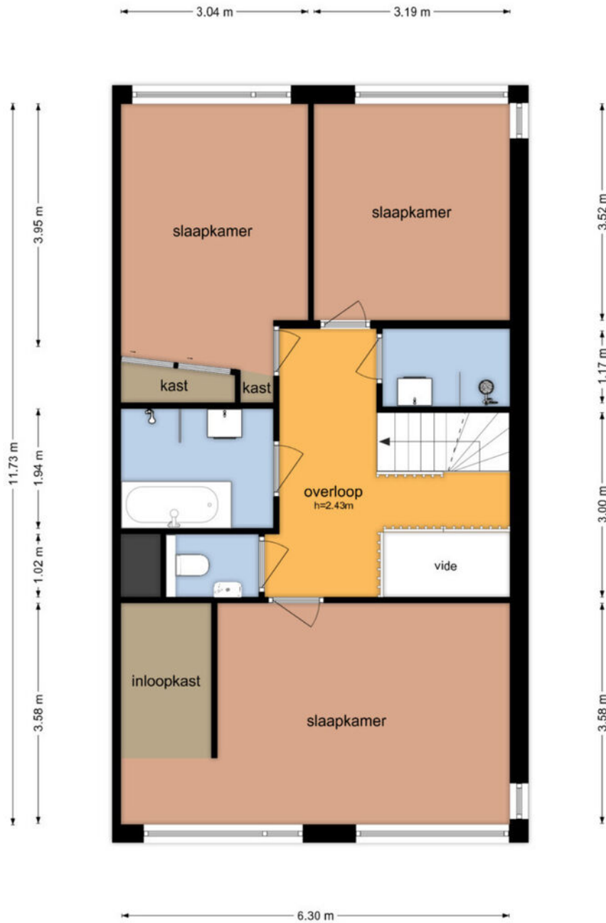
Brugwacht 140 - Leiderdorp Eerste Verdieping

De plattegronden zijn geproduceerd voor promotionele doeleinden en ter indicatie. Aan de plattegronden kunnen geen rechten worden ontleend © www.objectenco.nl