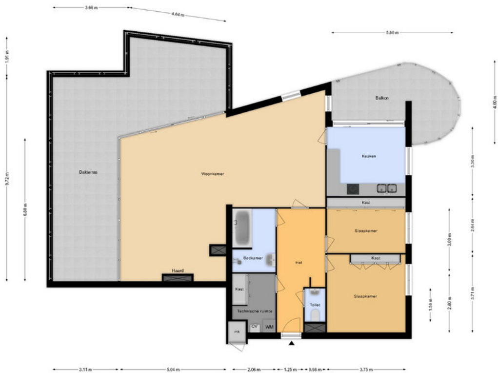
Buitendijklaan 128 Appartement

De plattegronden zijn met zorg samengesteld. De afmetingen zijn te benadering en kunnen afwijken van de werkelijke situatie. Aan de plattegronden kunnen geen rechten worden ontleend. Ondertekend: [Signature]